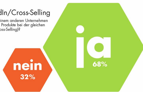
Umfrage, wieviel Unternehmen schon mal Crossselling betrieben haben